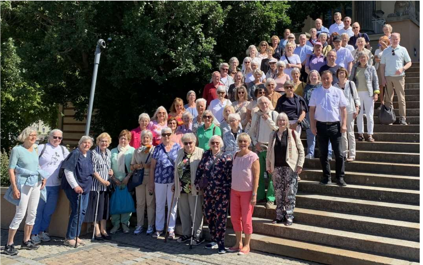
Fra Ballettens Venners rejse til Hamburg, juni 2022. Hele rejsegruppen på udflugt til Schwerin