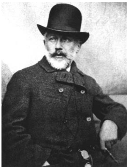
Pjotr Iljitj Tjajkovskij

Varighed: Arrangementet slutter ca. kl. 22.00.