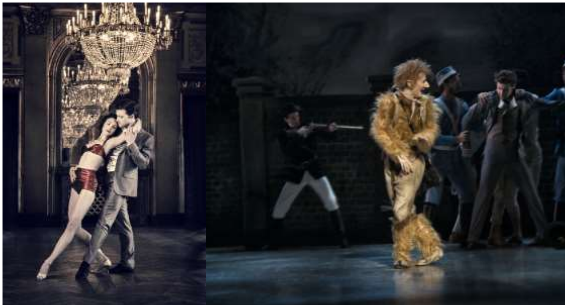
Come Fly Away , Kgl. Teater 2013, Foto: Henrik Stenberg – Et Folkesagn , Kgl. Teater 2014 Foto: Per Morten Abrahamsen