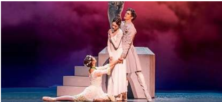
The Winter's tale

Foruden seks balletforestillinger, diverse sightseeing og mulighed for besøg i Ballettzentrum , hvor Hamburg Balletten, balletskolen og balletkostskolen har til huse, bliver der også tid til museumsbesøg og til shopping i det indkøbsmekka, som Hamburg også er. Hamburg er rig på museer. Museum für Kunst und Gewerbe med den berømte art nouveau-samling der blev grundlagt, da stilen var ny, kan varmt anbefales. Det kan også Kunsthalle , der råder over en enestående malerisamling.